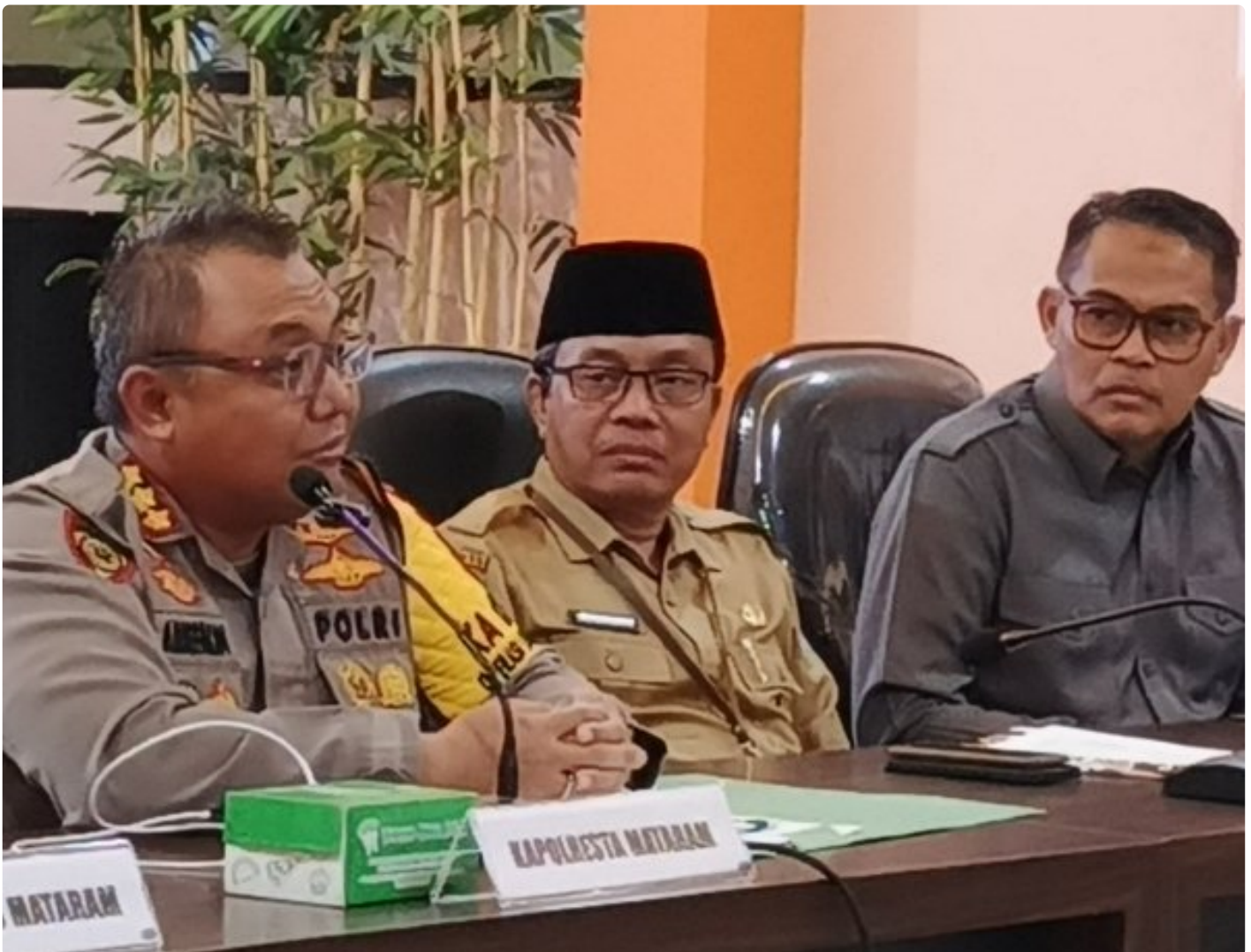
Kapolresta Mataram (Kiri) saat memimpin Konferensi pers akhir tahun, Selagi (31/12/2024)

MATARAM, NTB – Polresta Mataram mengakhiri tahun 2024 dengan menggelar Konferensi Pers Akhir Tahun, sebuah forum transparansi untuk memaparkan capaian dan inovasi yang telah dilakukan selama satu tahun. Kegiatan yang