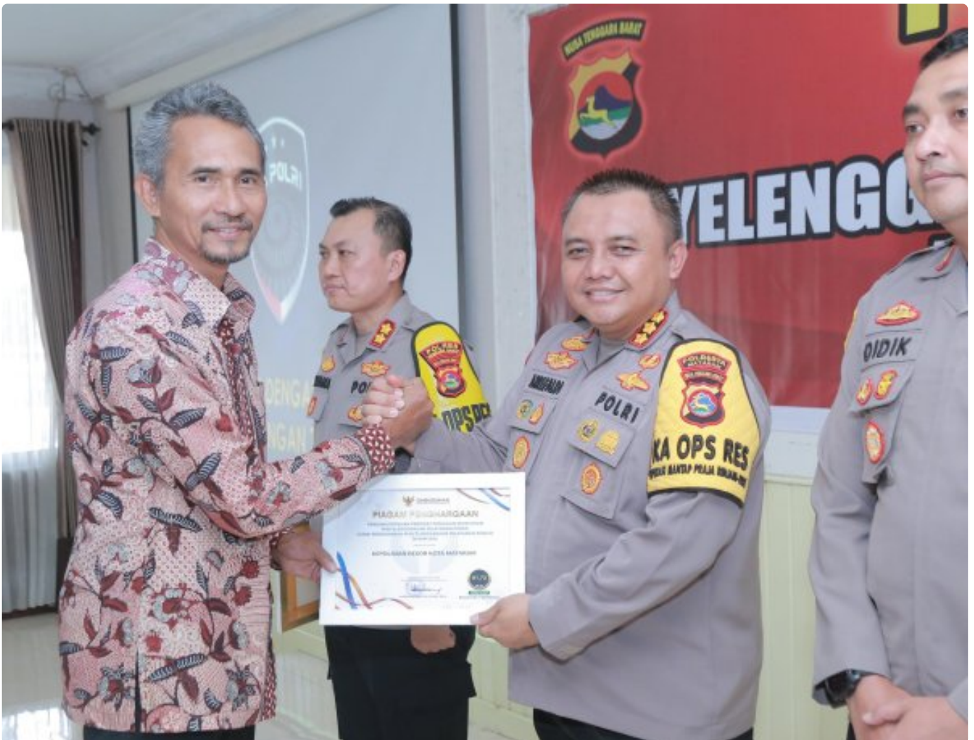
Kapolresta Mataram saat menerima Penghargaan dari Ombudsman RI perwakilan NTB, Kamis (19/12/2024)

MATARAM, NTB – Polresta Mataram kembali mengukir prestasi dengan meraih Predikat Kepatuhan Penyelenggaraan Pelayanan Publik Tahun 2024 dari Ombudsman NTB. Polresta Mataram menjadi salah satu dari delapan Polres/ta